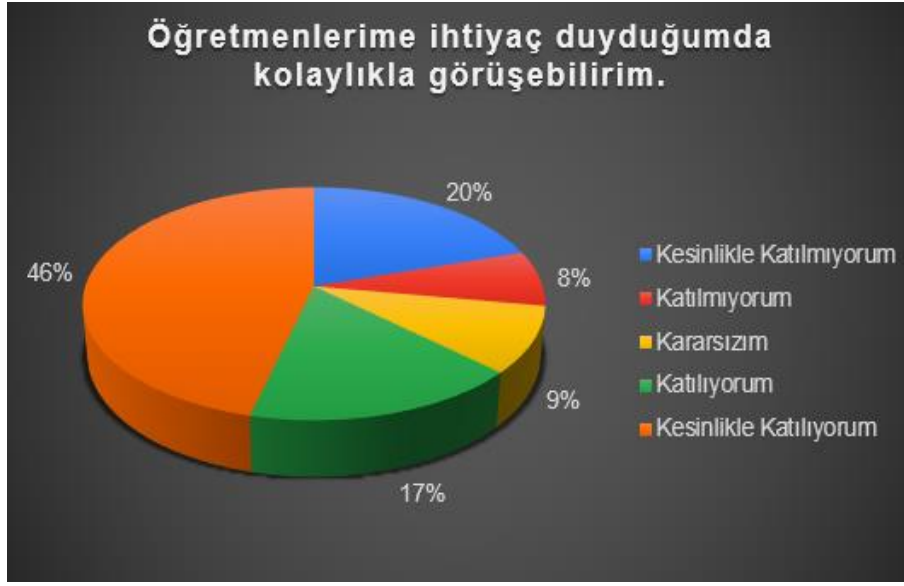
Şekil 1: Ortaokul Öğrencilerinin Ulaşılabilirlik Düzeyi

Yapılan ankete katılan ortaokul öğrencileri “Öğretmenlerime ihtiyaç duyduğumda kolaylıkla ulaşabilirim” sorusuna %46 oranında kesinlikle katılıyorum cevabını verirken, %20 si kesinlikle katılmıyorum cevabını vermiştir.