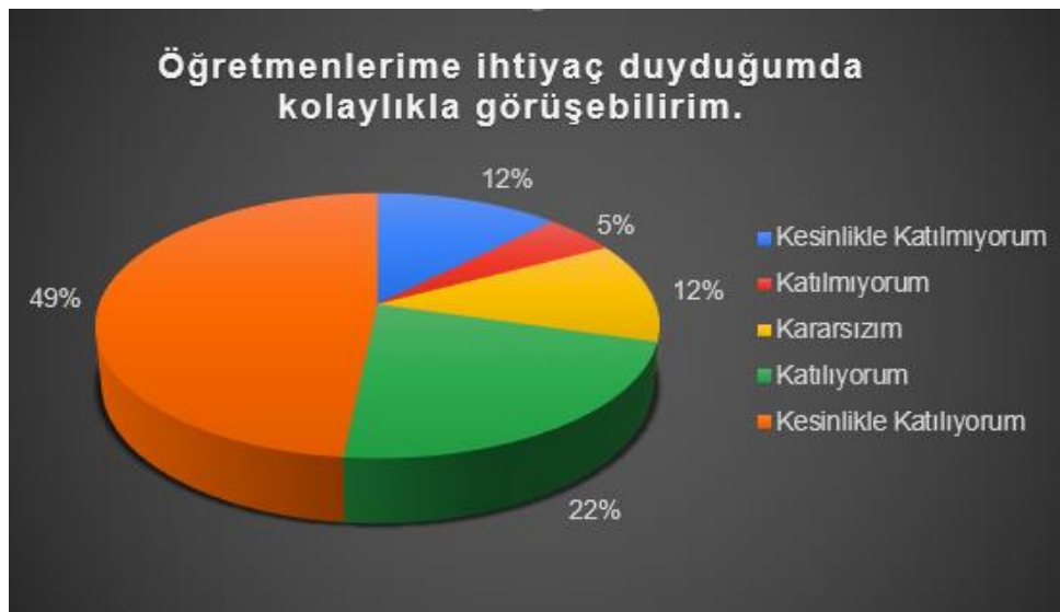
Şekil 3: Lise Öğrencilerinin Ulaşılabilirlik Düzeyi