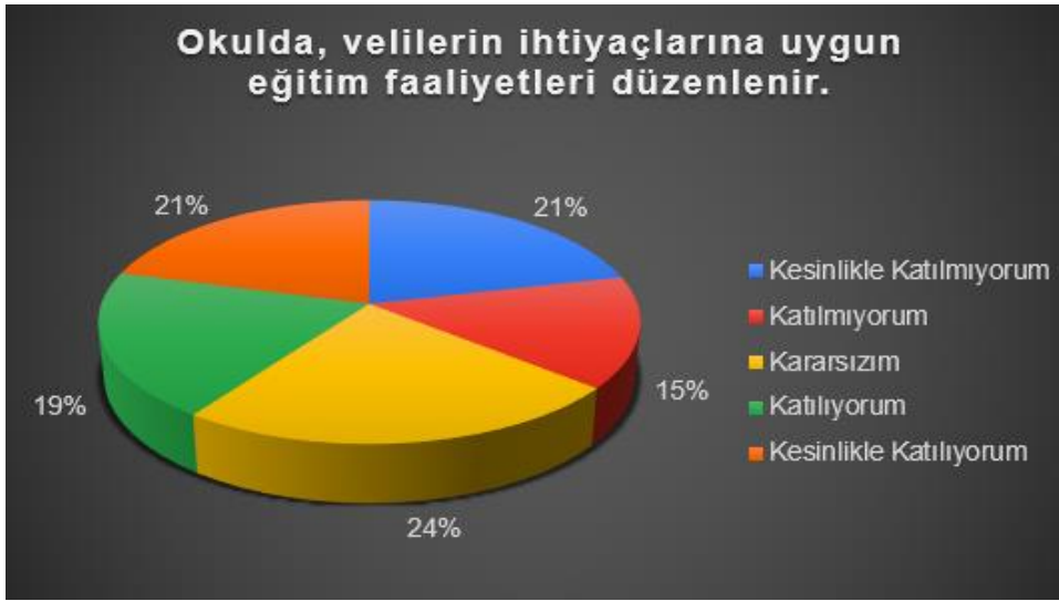
Şekil 8: Okul Veli Eğitim Faaliyeti Düzeyi

“Çocuğumun her gün okula gitmesini sağlarım” sorusuna ankete katılan velilerimizden % 76’ sı kesinlikle katılıyorum cevabı vermiştir.