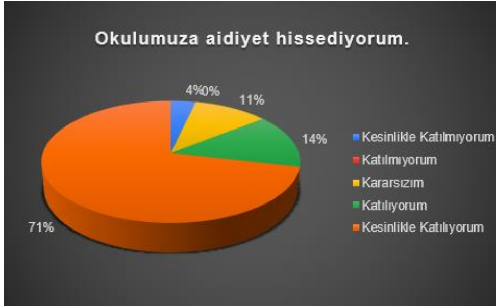
Şekil 5: Öğretmenlerin Okula Aidiyet Hissi Düzeyi

“Okulumuza aidiyet hissediyorum” sorusuna ankete katılan öğretmenlerden %71’i kesinlikle katılıyorum cevabını vermiştir.