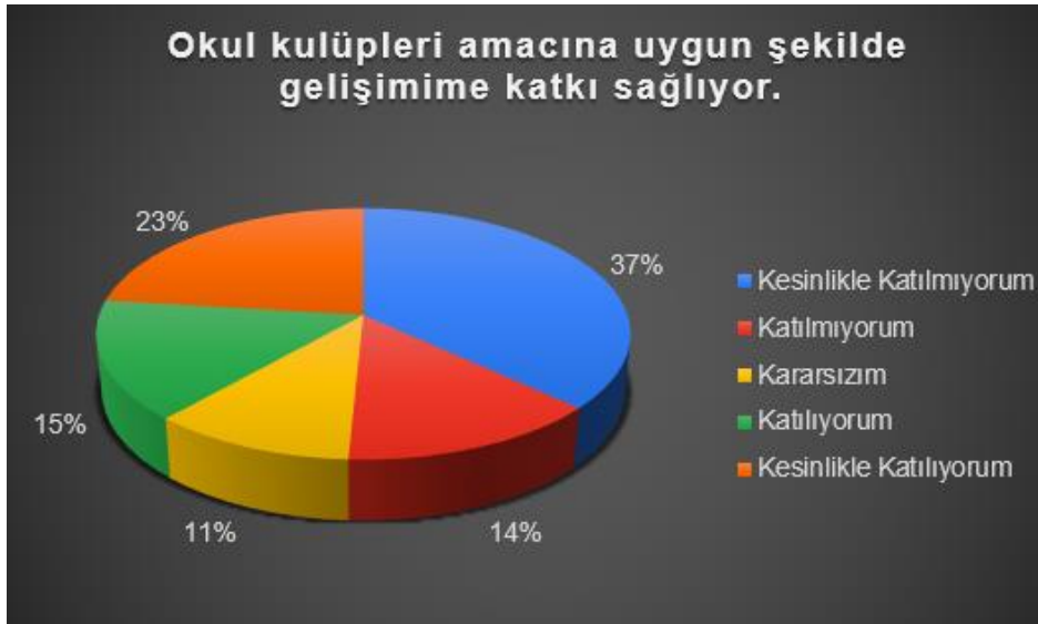
Şekil 2: Ortaokul Okul Kulüplerinin Etkililik Düzeyi

Yapılan ankete katılan ortaokul öğrencileri “Öğretmenlerime ihtiyaç duyduğumda kolaylıkla ulaşabilirim” sorusuna %46 oranında kesinlikle katılıyorum cevabını verirken, %20 si kesinlikle katılmıyorum cevabını vermiştir.