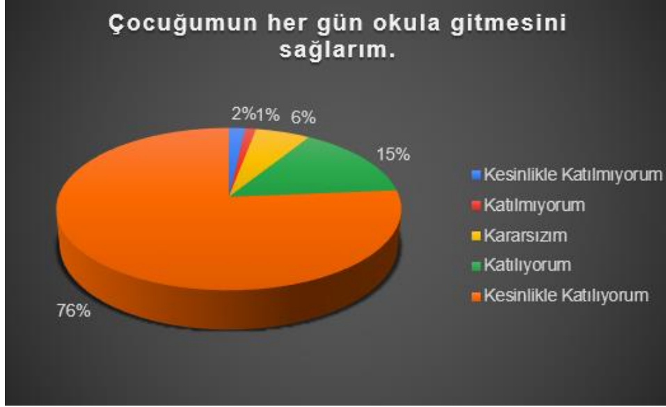
Şekil 7: Veli Sorumluluk Düzeyi

“Çocuğumun her gün okula gitmesini sağlarım” sorusuna ankete katılan velilerimizden % 76’ sı kesinlikle katılıyorum cevabı vermiştir.