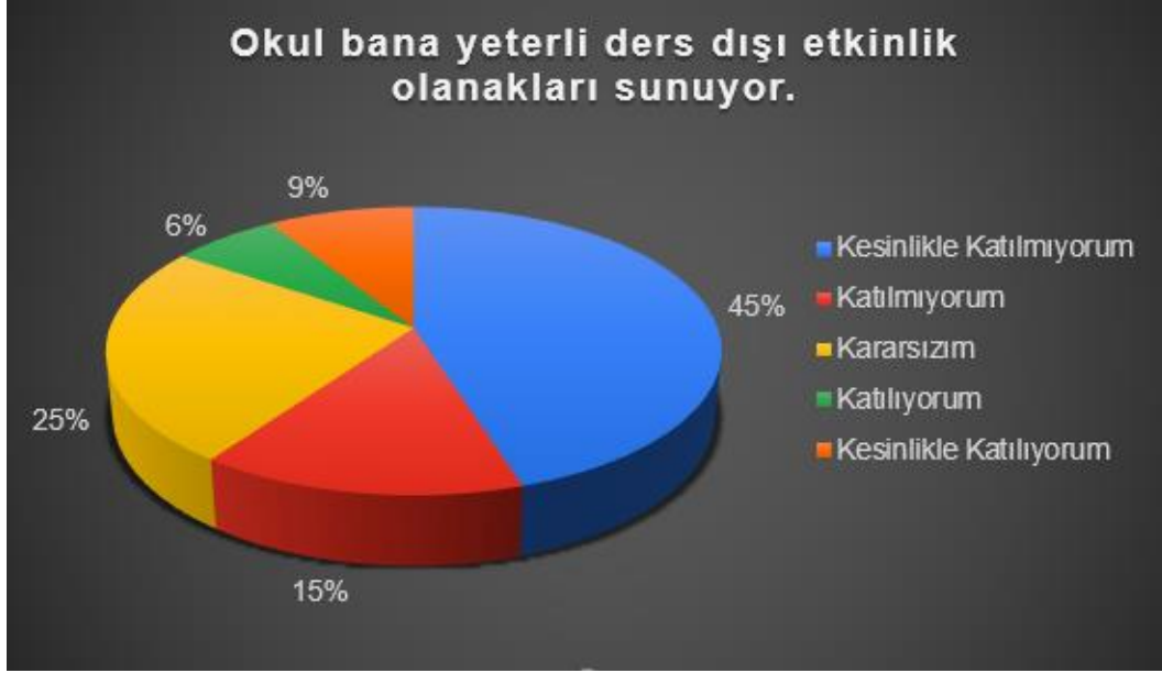
Şekil 4: Lise Öğrencileri Okul Ders Dışı Etkinlik Düzeyi

Yapılan ankete katılan lise öğrencileri “Öğretmenlerime ihtiyaç duyduğumda kolaylıkla ulaşabilirim” sorusuna %49 oranında kesinlikle katılıyorum cevabını verirken, %12 si kesinlikle katılmıyorum cevabını vermiştir.